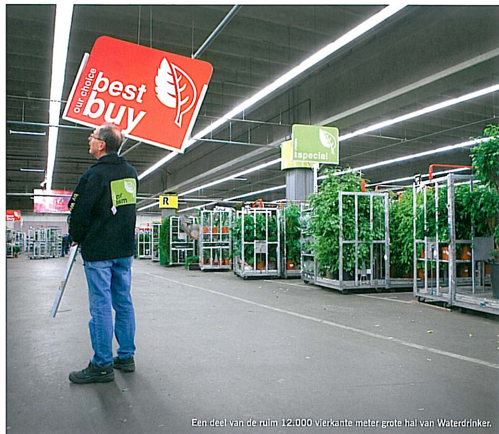
Een deel van de ruim 12.000 vierkante meter grote hal van Waterdrinker.