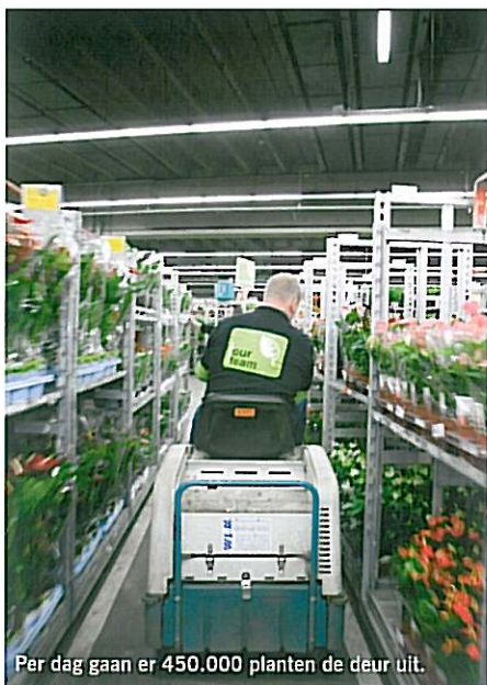
Per dag gaan er 450.000 planten de deur uit.

kopen én kijken. Hier doen ze inspiratie op”, legt Foppen uit. Maar ook inkopers van tuincentra en grootwinkelbedrijven lopen hier graag een rondje. Waterdrinker geldt in de markt als trendsetter. Foppen: “Dit jaar breiden we onze Cash & Carry uit met een webshop. Maar ook klanten die online hun bestellingen regelen, zullen van tijd tot tijd hier komen. Bloemisten willen toch zien, ruiken en voelen.”